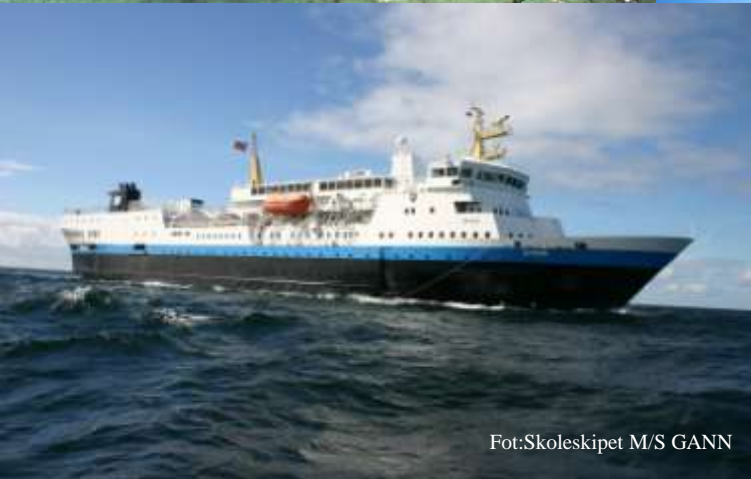
Fot:Skoleskipet M/S GANN