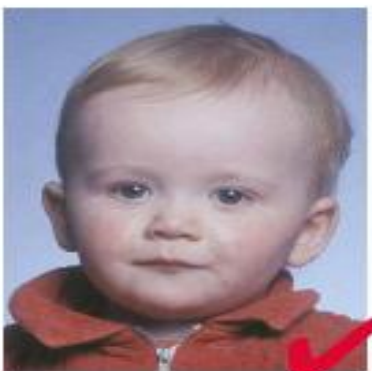
nr 4: barn, kvalitetskrav som voksen