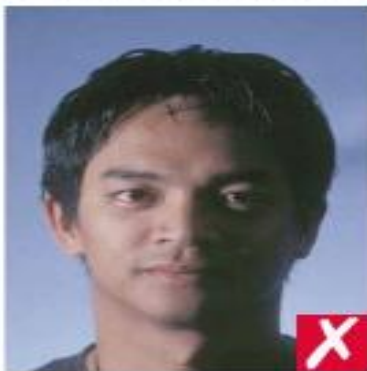
nr 2: skygge over ansiktet