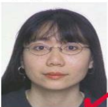
nr 5: briller OK