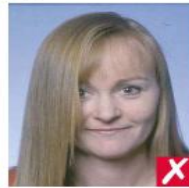
nr 3: hår skjuler øynene