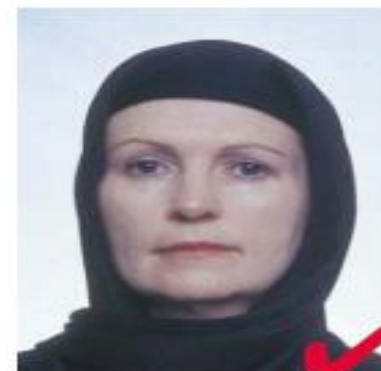
nr 6: religiøst hodeplagg riktig