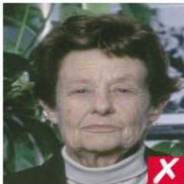
nr 1: urolig bakgrunn