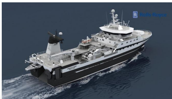
Prestfjord, Andøy havfiske Aker Seafood, Nergaard