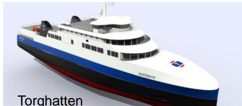
Torghatten Boreal Nord