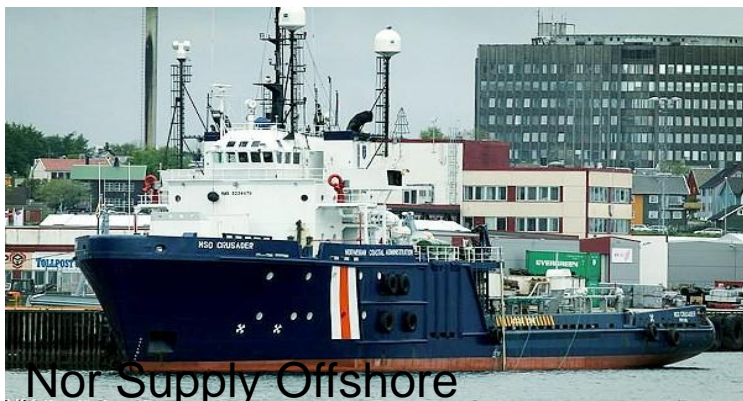
Nor Supply Offshore